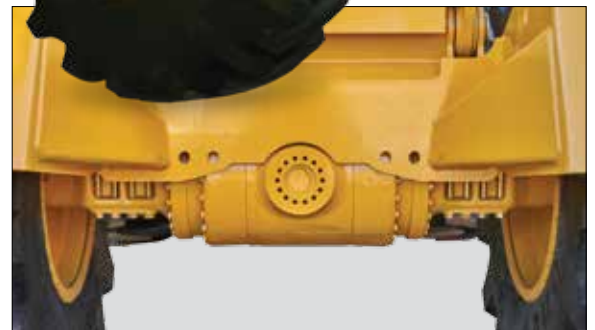
Gut geschützte Achsen.