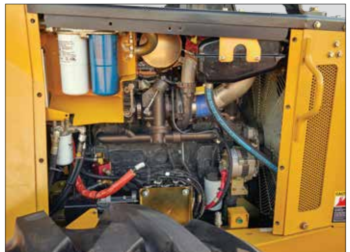
Ordentlicher, sauberer Motorraum mit schnellem Zugriff auf täglich zu wartende Bereiche.