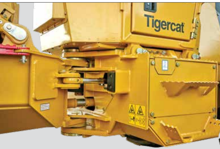
Stabiles Mittelteil mit überdimensionierten Bolzen und Kegelrollenlagern.